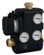
LK 810 2.0