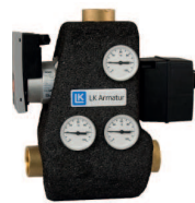
LK 811 E Eco